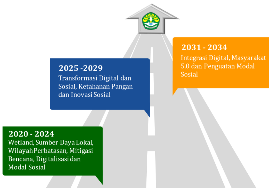
Gambar 1-1 Roadmap Kelompok Tema Unggulan Riset FISIP Universitas Riau

Peta jalan penelitian Fakultas Ilmu Sosial dan Ilmu Politik dirumuskan mengacu pada Roadmap Penelitian Universitas Riau yang tertuang dalam Renstra Penelitian Universitas Riau Tahun 2020 – 2024 dan Peraturan Presiden Republik Indonesia Nomor 38 Tahun 2018 Tentang Rencana Induk Riset Nasional Tahun 2017-2045. Dengan tujuan menjadi acuan bersama antara Universitas dan Fakultas dalam mensinergikan langkah-langkah mencapai Visi FISIP yaitu “ Terwujudnya Fakultas Riset yang Unggul dan Bermartabat di Bidang Ilmu Sosial dan Ilmu Politik di Indonesia Tahun 2035 ”. Roadmap tersebut terbagi dalam 3 Kelompok Tema Unggulan Riset.